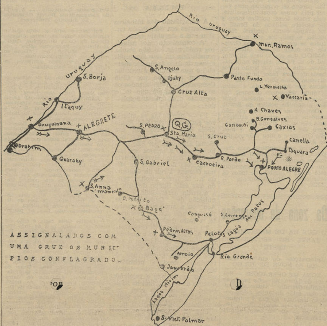
ASSIGNALADOS COM UMA CRUZ OS MUNICIPIOS CONFLAGRADOS